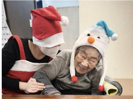
そしてクリスマス忘年会当日。体調不良者もなく、全員参加の幸先の良いスタートが切れました。

12月25日、毎年恒例となったクリスマス忘年会を開催。 クリスマス忘年会当日までは、スタッフ一同が、クリスマスメニューを検討したり、去年のプレゼントが被らない様に考えるなど、日々試行錯誤しながら本番当日を待ち焦がれるイベントです。